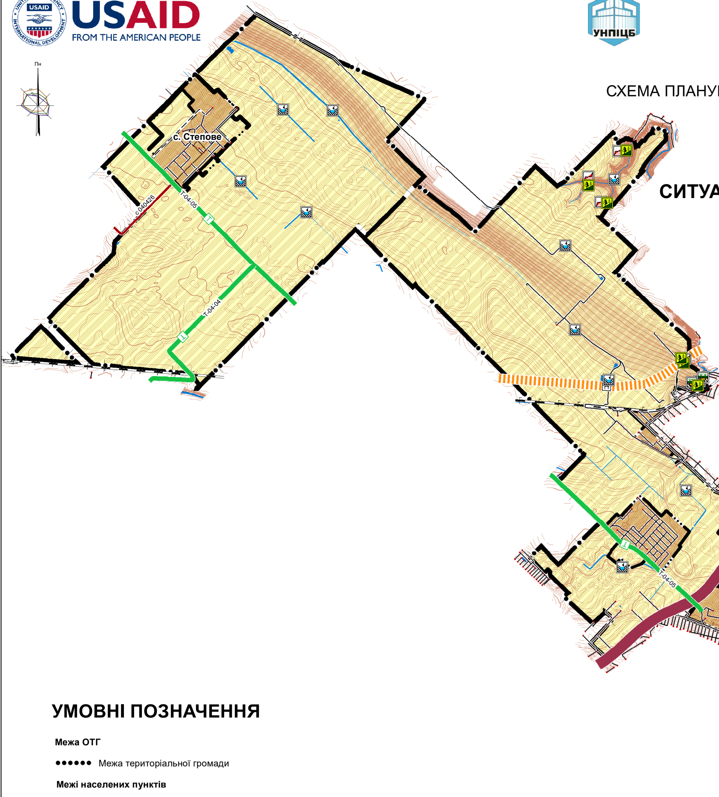
СХЕМА ІНЖЕНЕРНОЇ ПІДГОТОВКИ ТА ЗАХИСТУ ТЕРИТОРІЇ ВІД НАДЗВИЧАЙНИХ СИТУАЦІЙ ПРИРОДНОГО ТА ТЕХНОГЕННОГО ХАРАКТЕРУ